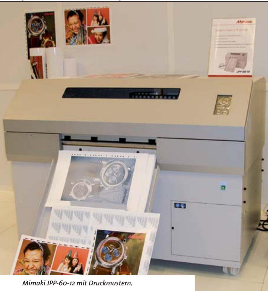
Mimaki JPP-60-12 mit Druckmustern.