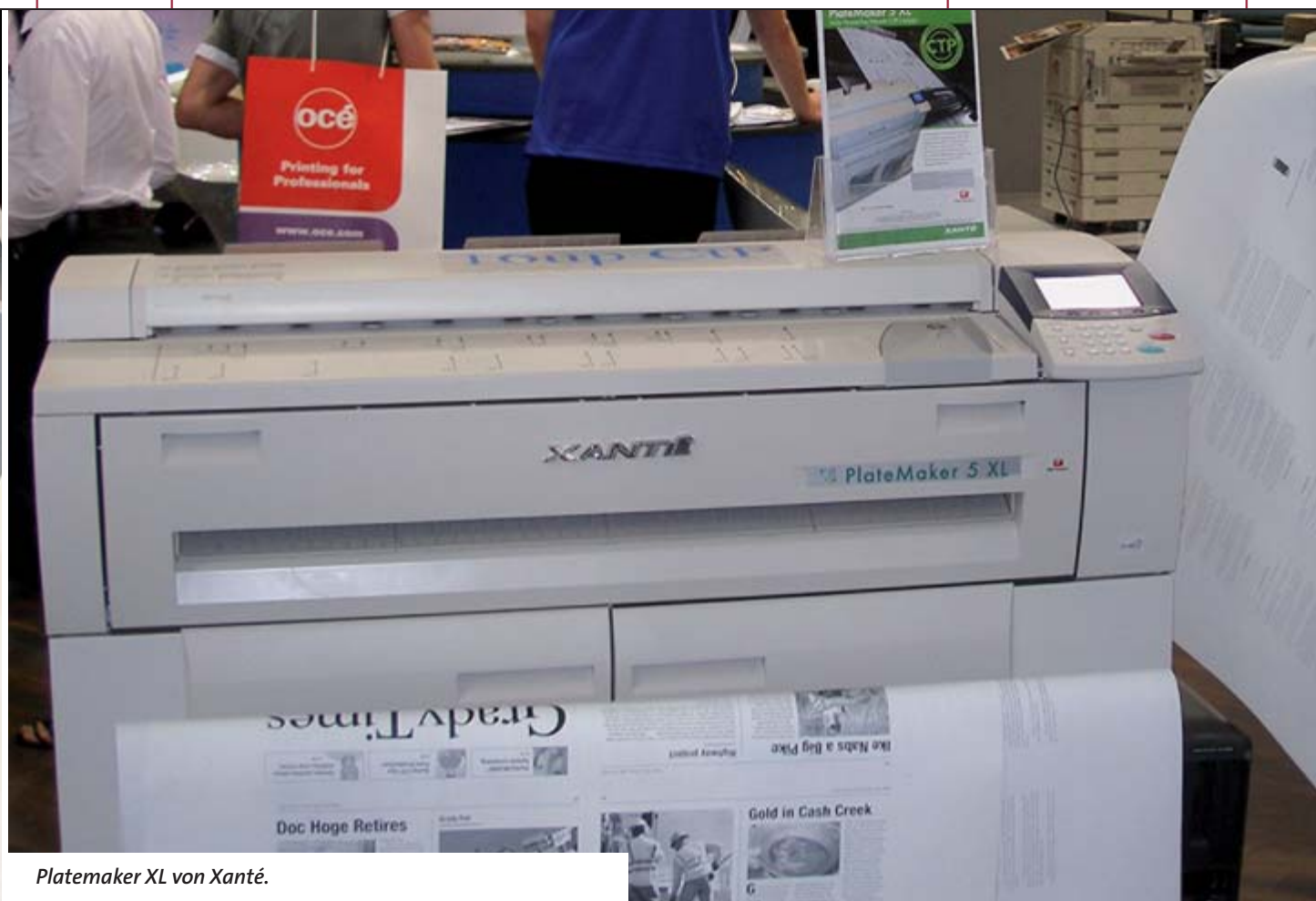
Platemaker XL von Xanté.

– der Markt treffen, und der verlangt neben Qualität auch einen wirtschaftlichen und technisch stabilen Betrieb: Kriterien, die sich bei einer einmaligen Vorführung nur begrenzt erschließen lassen. Die Qualitätsbeurteilungen – soweit sie getroffen werden konnten – können sich auch nur auf die vorgelegten Druckmuster beziehen. Trotz dieser Einschränkungen sollten sie einen ersten Anhalt bieten.