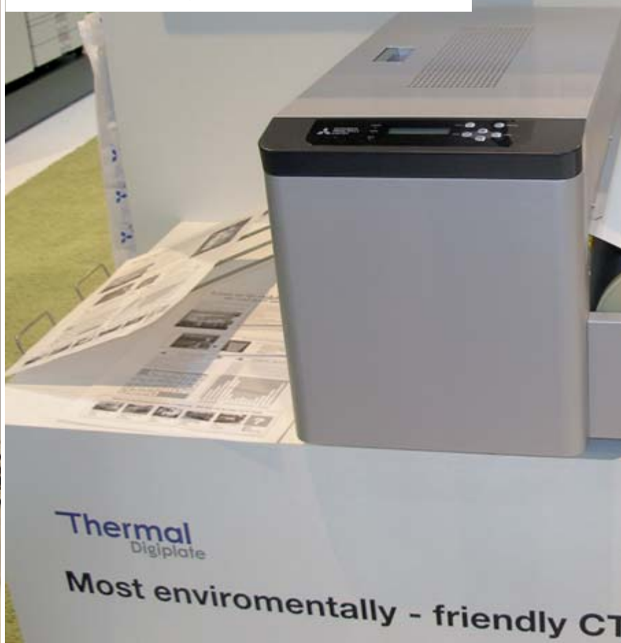
A3-Belichter Thermal Digiplate von Mitsubishi.