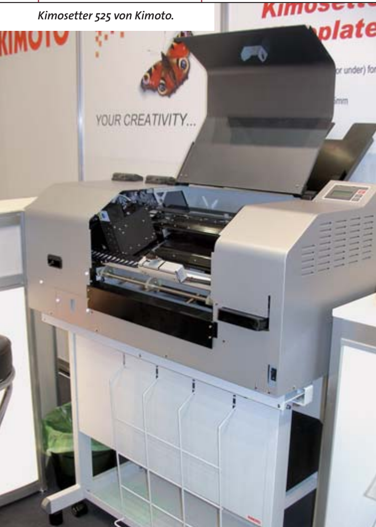
Kimosetter 525 von Kimoto.