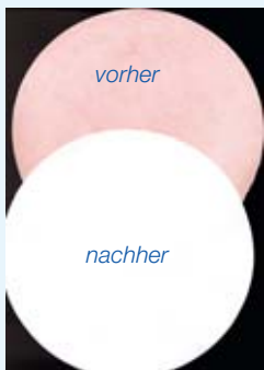
Das Filtrat des Flotationsversuchs nach INGEDE Methode 11 beweist die sehr gute Deinkbarkeit unserer mattgestrichenen Inkjetpapiere und garantiert somit einen reibungslosen Recyclingkreislauf.