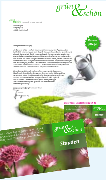
Transpromo-Dokumente überzeugen durch Farbbrillanz und die farbgetreue Darstellung von Markenzeichen und Fotos.