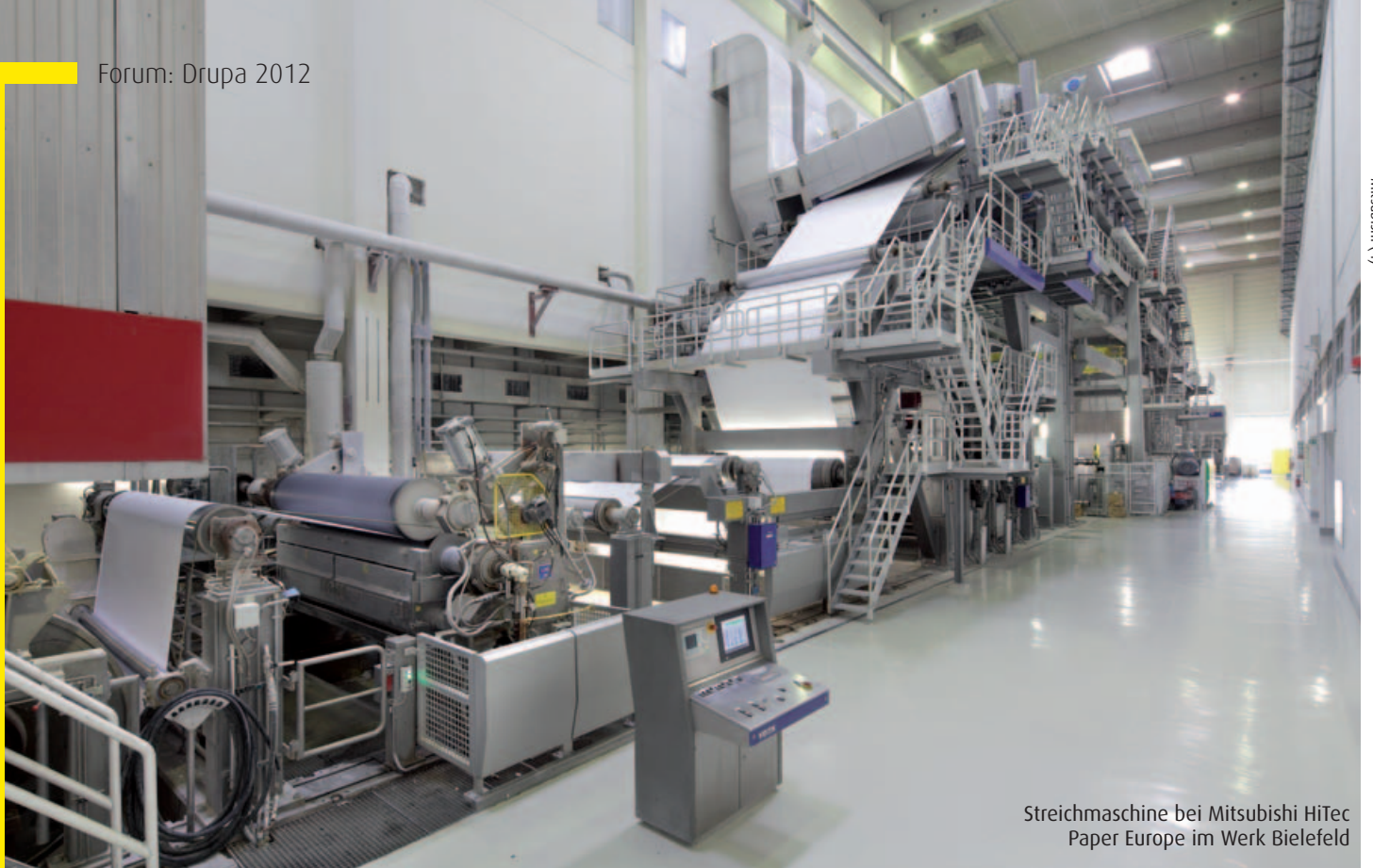
Streichmaschine bei Mitsubishi HiTec Paper Europe im Werk Bielefeld