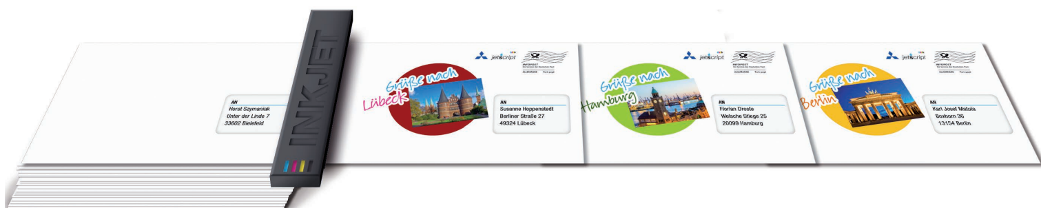
Aufmerksamkeitsstarke, personalisierte Umschläge im Inkjet-Digitaldruck