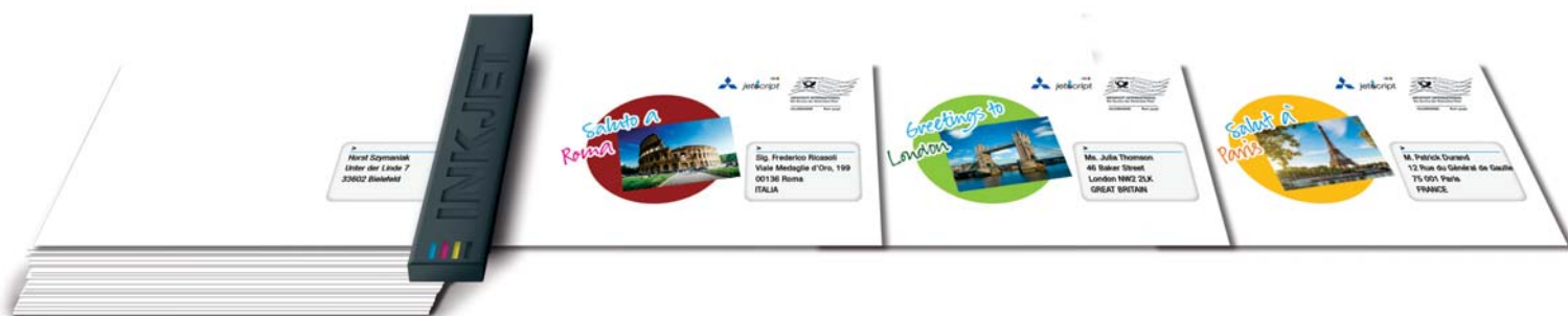
Sobres ("sobres personalizados impresos en inkjet digital, llamativos")