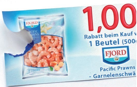
MH 1484 CCB – Coupon mit Sicherheitsmerkmal (farbiges Basispapier)

Die schnelle Entwicklung des modernen Hochgeschwindigkeits-Inkjetdrucks ermöglicht täglich neue Anwendungen. Heute werden nicht nur individualisierte und personalisierte Transaktions- und Transpromo-Dokumente gedruckt, sondern auch Mailings, Karten, Broschüren, Bücher, Briefumschläge, Coupons, Tickets und vieles mehr.